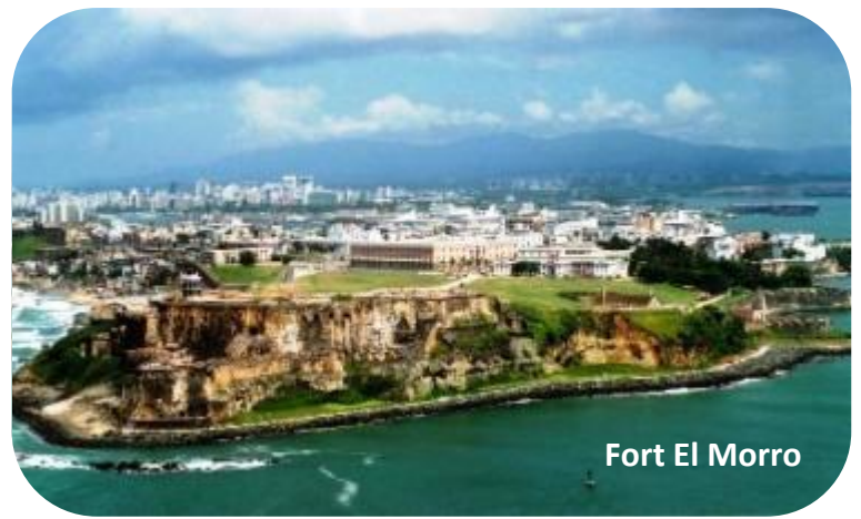
Fort El Morro