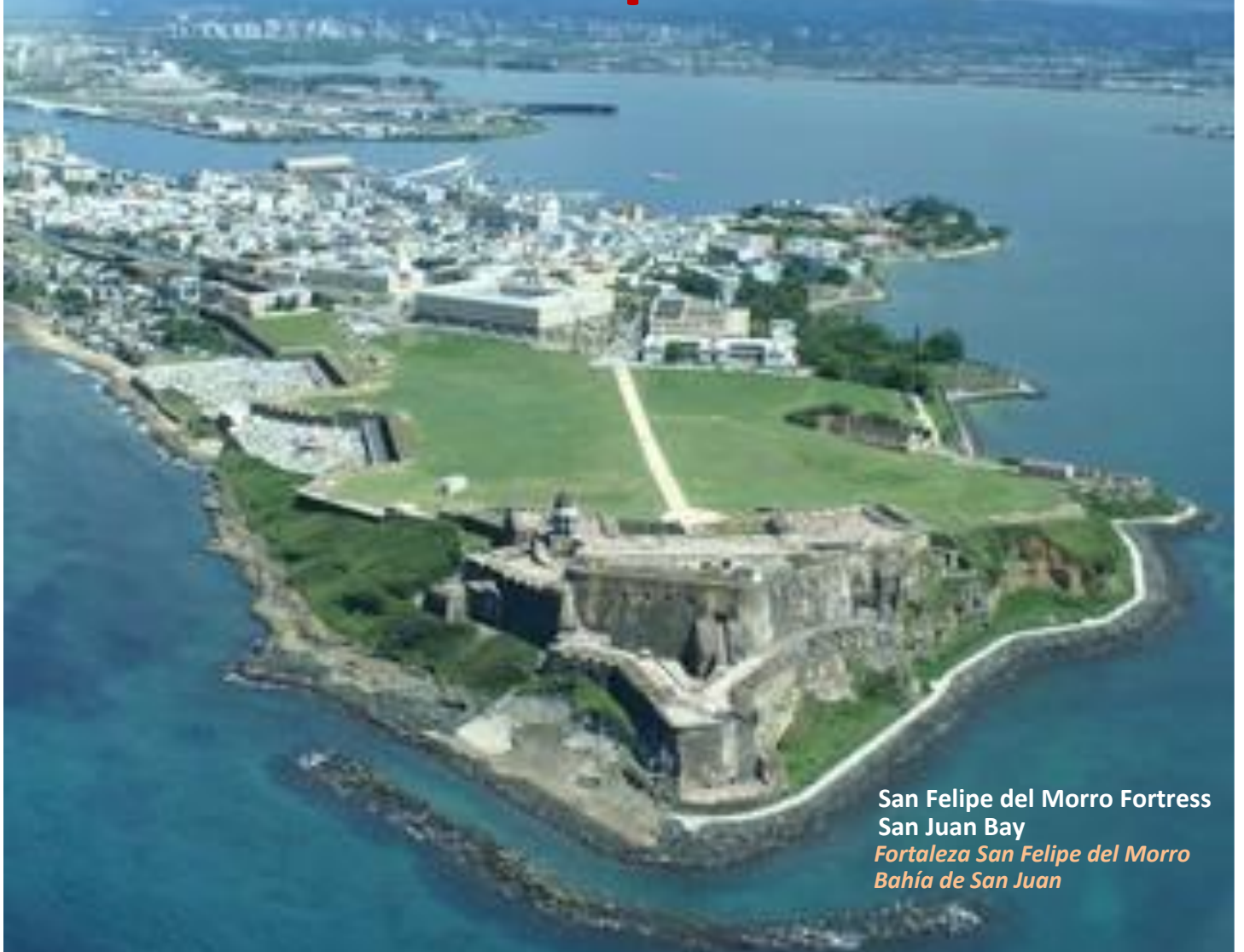
San Felipe del Morro Fortress San Juan Bay Fortaleza San Felipe del Morro Bahía de San Juan

San Juan, Puerto Rico 20 th ⇒ 22 nd September 2012