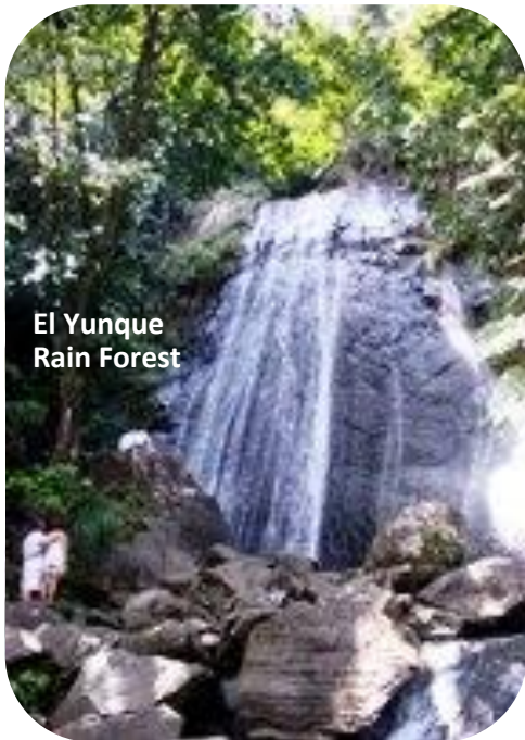
El Yunque Rain Forest