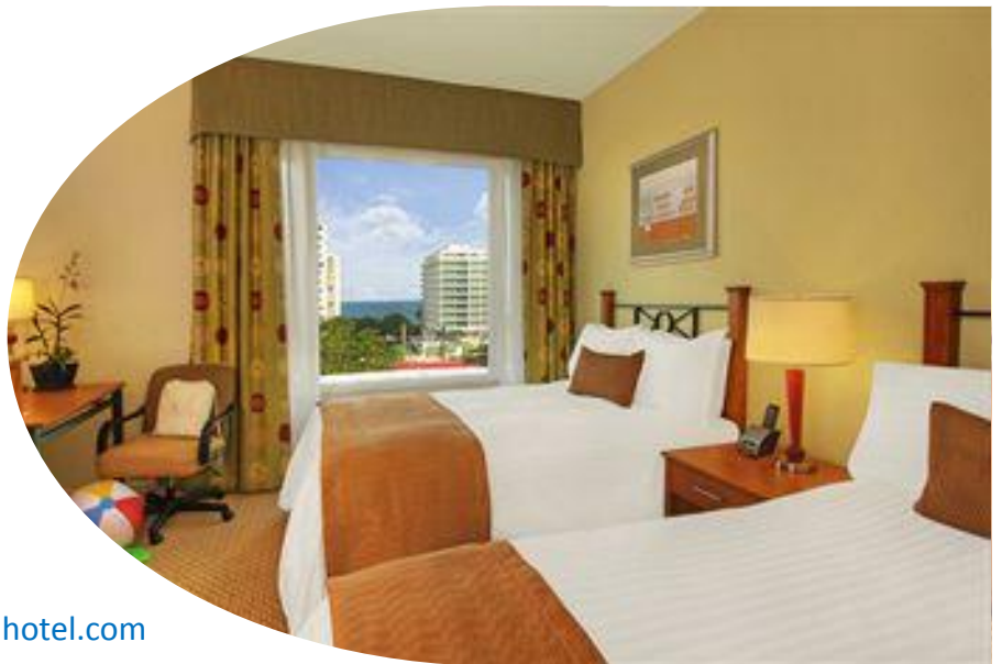
Twin-Bedded room / Habitación doble

Hotel Verdanza Calle Tartak 8020, Isla Verde Carolina, PR 00979 Fax Reservas: +1-787.625.9014 Fax Ventas: +1-787.253.9007 Correo Electrónico: feelthevibe@verdanzahotel.com