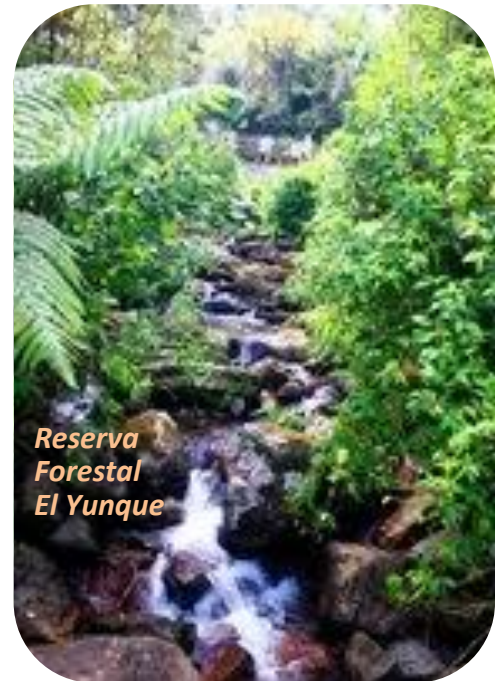
Reserva Forestal El Yunque