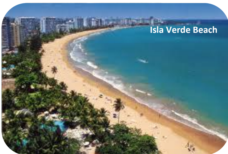
Isla Verde Beach